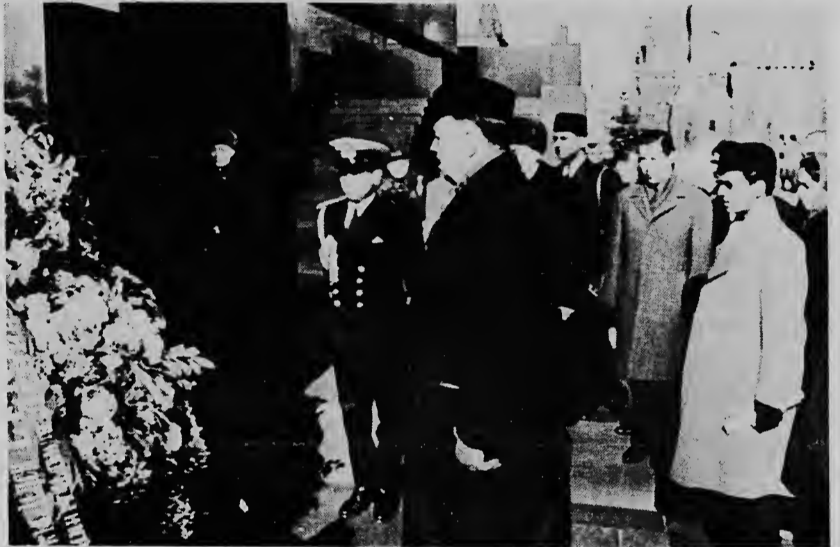
MOSCU-Den center nos por mira presidente di Pakistan, Ayub Khan despues di a pone un krans riba tumba di Lenin. Riba e mesun dia el a conferencia cu e ministernan sovietico Leonid Brezhnev y Alexei Kosygin riba questionnan di relacionnan entre Rusia y Pakistan y tambe riba problemnan internacional of interes mutuo.

Pero e rusionan a laga e convoynan militar norteamericano pasa mes ora. E promer di nana cuminsa e viaje 7,45 y e segundo 8,45 e tercer mei ora despues.